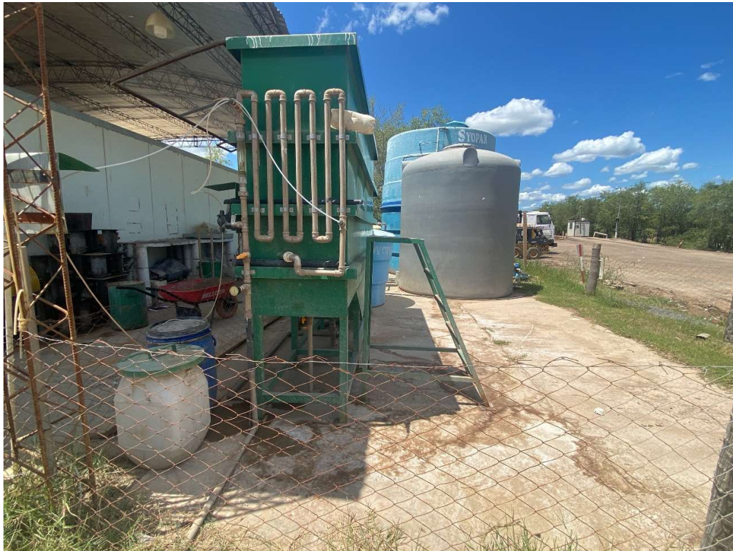
Figura 2. Planta compacta de potabilización

En la imagen se observa una planta potabilizadora compacta de agua de tajarar; en la cual los procesos de floculación se realizan con agitadores mecánicos, decantación, filtración y posterior cloración.