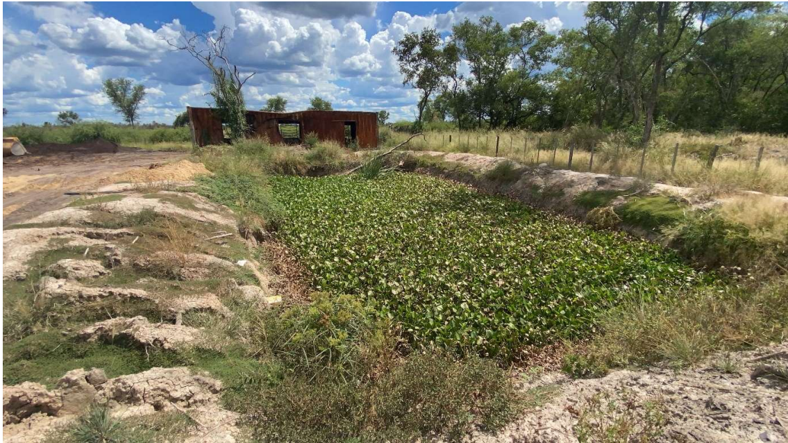
Figura 1. Laguna de estabilización con Pistia stratiotes

Se debe pensar en medidas de Adaptación Basadas en la Naturaleza, como los métodos biológicos de disposición de heces cloacales, para minimizar el impacto de estos residuos en cada hogar, o algunos vecinos, como son las lagunas de depuración biológicas, como las implementadas por las empresas contratistas de la Ruta 9, en el Chaco, bajo las condiciones climáticas similares a las que se encuentran las comunidades de AbE Chaco.