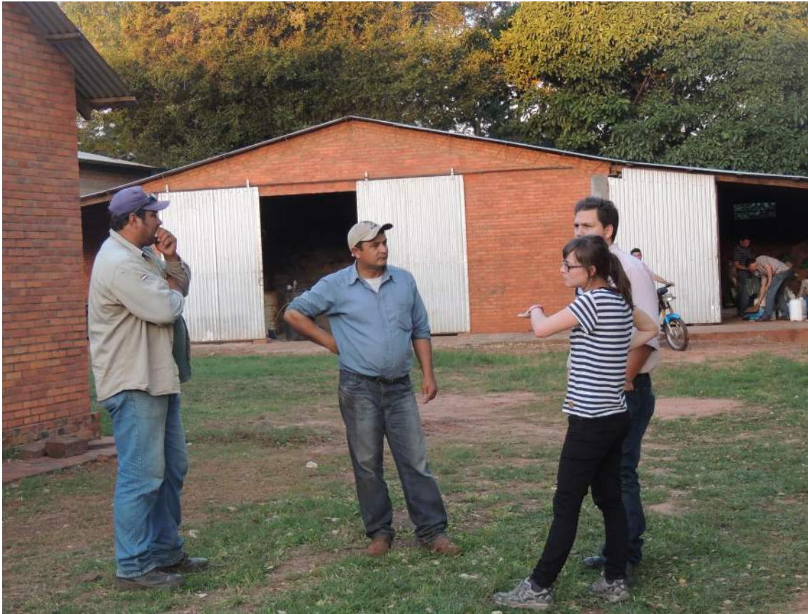
Productores de Volendam con UNIQUE y WWF.