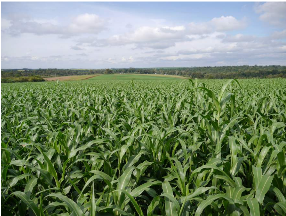
Puerto Barra, Paraguay. Fotógrafo: Fabianus Fliervoet | WWF Paraguay, 2014

Debido a esto, se ha identificado que las actividades potenciales a ser realizadas son las de manejo forestal sostenible, ya que aún cuentan con bosques, y la producción bajo sistemas silvo-pastoriles de madera de alta calidad. Mediante esta actividad se podrían reforestar aproximadamente 3 ha en cada finca, lo que puede significar aproximadamente 510 ha. Los sistemas silvo-pastoriles pueden aumentar los beneficios económicos debido a la combinación de la producción de ganado vacuno y madera de buena calidad con especies exóticas de rápido crecimiento.