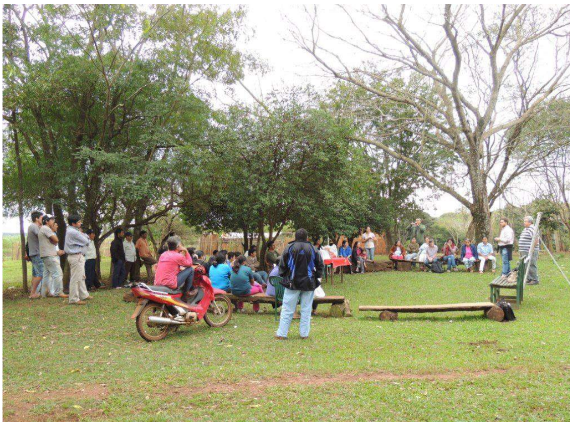
Taller de capacitación en Golondrina, Caazapá.

El paisaje en el cual se inserta Golondrina es sumamente complejo, ya que cuenta con una diversidad de sistemas de producción desde bosques manejados sustentablemente según los principios del FSC, agricultura mecanizada, ganadería, hasta pequeñas parcelas de agricultura de subsistencia en comunidades indígenas. Esta diversidad de sistemas y la posibilidad de construcción de un proyecto integral de manejo y recuperación de los bosques remanentes hacen que esta zona pueda ser identificada como potencial para desarrollar un proyecto piloto REDD+.