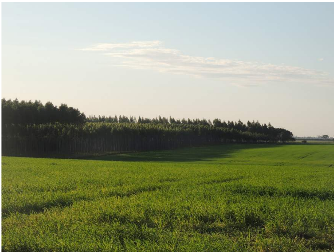
Reforestación de especies exóticas. Cuatro Vientos.

La comunidad de Cuatro Vientos se localiza en el Distrito de Villa del Rosario, Departamento de San Pedro. Desde 1999 trabaja coordinadamente con la Cooperativa Volendam, constituyéndose en un buen ejemplo de los avances que pueden obtenerse mediante el trabajo entre el pequeño y el gran productor agropecuario.