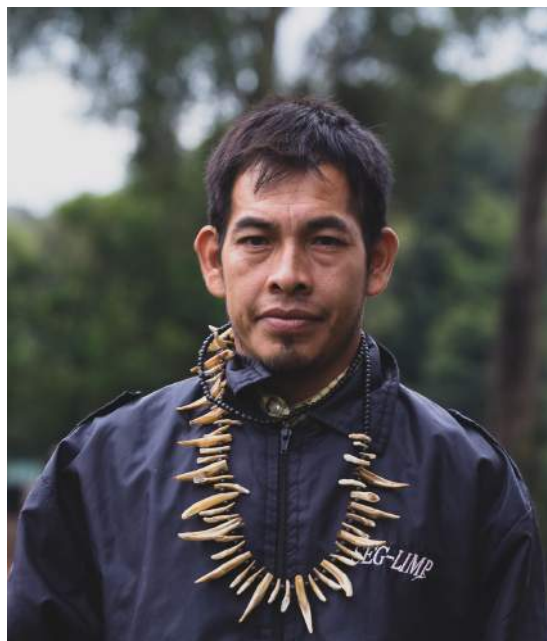
Puerto Barra, Comunidad Ache, Paraguay