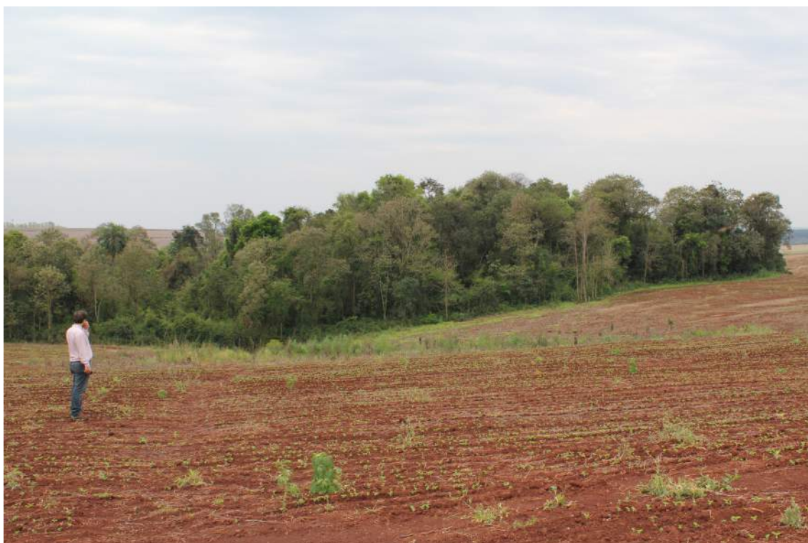
Cultivos de soja, Pirapo, Paraguay. Fotógrafo: Amanda Parker | WWF Paraguay, 2013

En base a la experiencia en los sitios de estudio a continuación se plantea un listado básico de información necesaria para evaluar la factibilidad de implementación de proyectos REDD+ en comunidades campesinas e indígenas. Es importante aclarar que independientemente de la identificación positiva de todos los factores necesarios para implementar REDD+, en el caso de comunidades indígenas, además, deberán seguirse todos los pasos que aseguren el consentimiento, previo libre e informado de estas comunidades antes de iniciar proyectos piloto REDD+ en sus territorios.